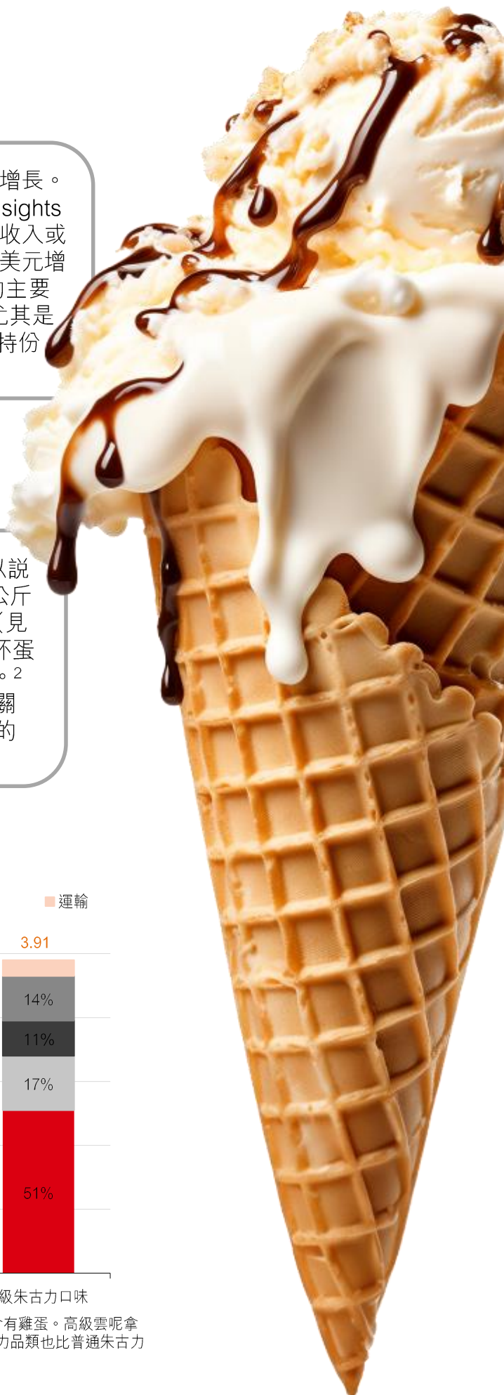
圖 1：雪糕對氣候的影響

雪糕會產生很大的氣候影響，可以說遠超過其他食品。例如，生產 1 公斤優質雲呢拿雪糕的二氧化碳排放量為 3.94 公斤（見圖 1），由此產生的氣候影響是生產同等數量紙杯雪糕的 1.8 倍，以及生產朱古力外層餅乾的 2.2 倍。 2 我們相信這會令零售商對減少雪糕對氣候影響相關的承諾有著更嚴格的審查，同時也會對雪糕產生的社會層面問題加以考慮。