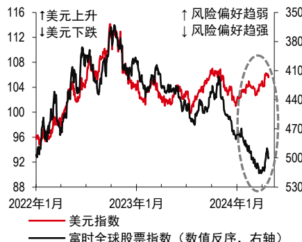
2. 美元指数和风险偏好