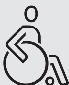
完全喪失行為能力